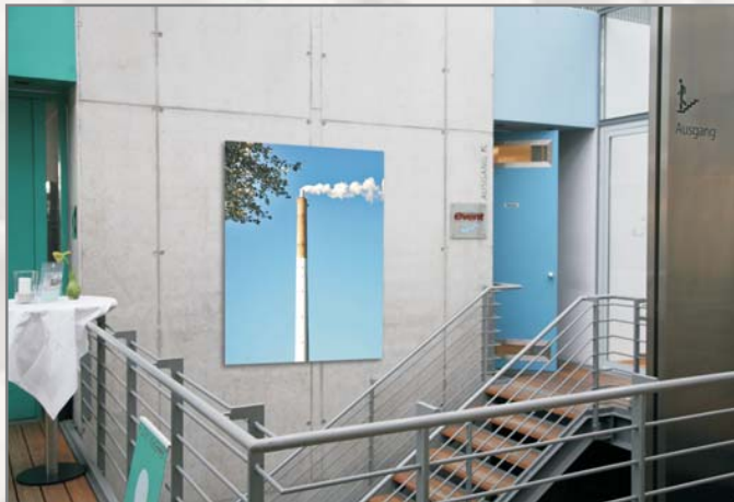
Profil Borken 8