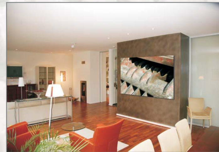
Profil Braunschweig 7