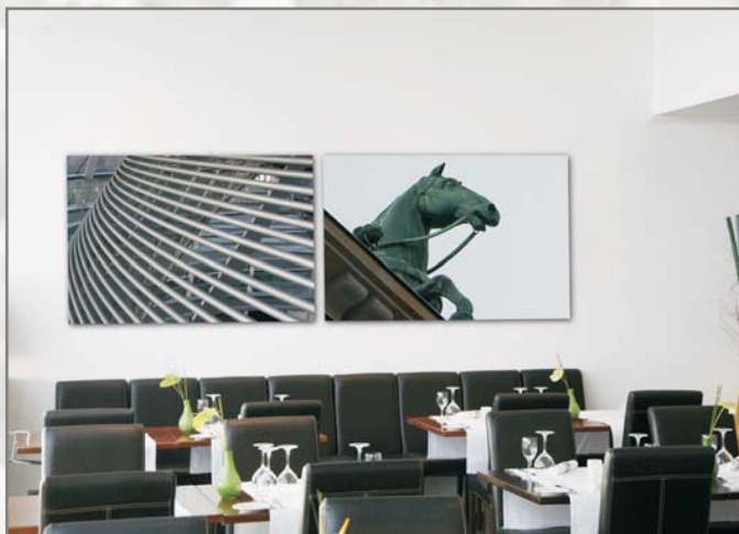
Profil Berlin 34 u. 39.