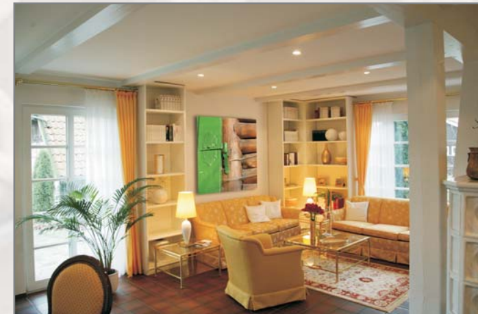
Profil Harz 9