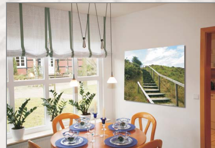
Profil Sylt 6