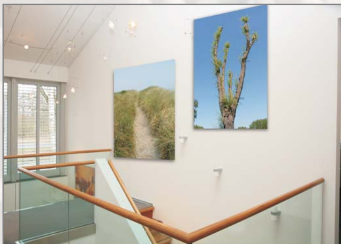
Profil Sylt 22 u. Hemmingen 1